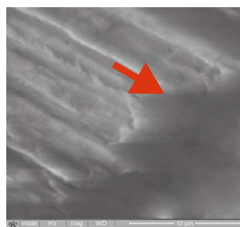
Фото СЭМ. Зуб, удалённый по ортодонтическим показаниям, запломбирован материалом SM Seal® Duo. После отверждения в латеральном разрезе на границе корневого канала видно, что материал проник в микроканальцы и загерметизировал их.

*ГОСТ 31071 — «Материалы стоматологические для пломбирования корневых каналов зубов»